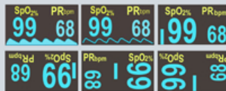
表示タイプは6種類 TYPE-A